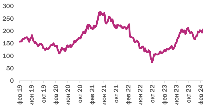
Диаграмма P/E и роста EPS